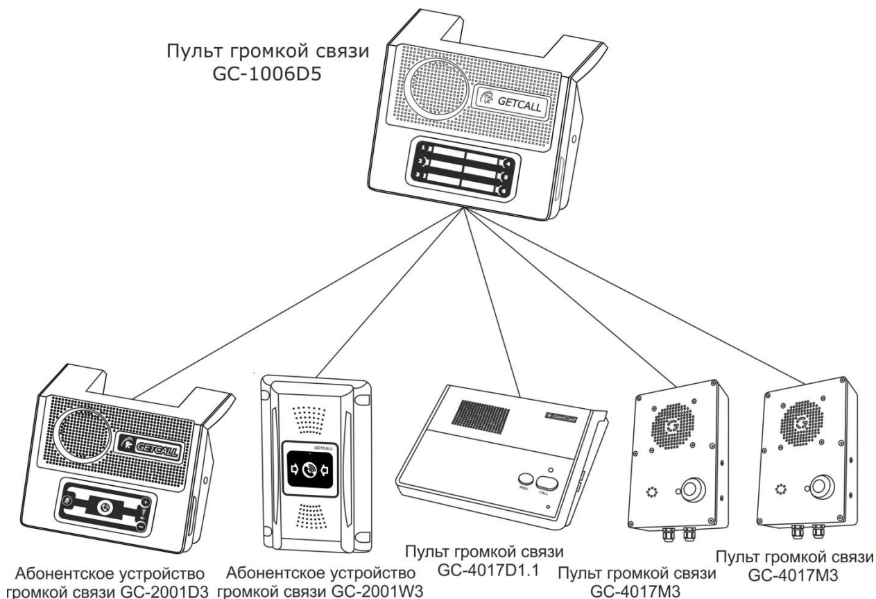
Рисунок 3. Структурная схема комбинированной системы связи

На рис.3 приведена структурная схема комбинированной системы связи.