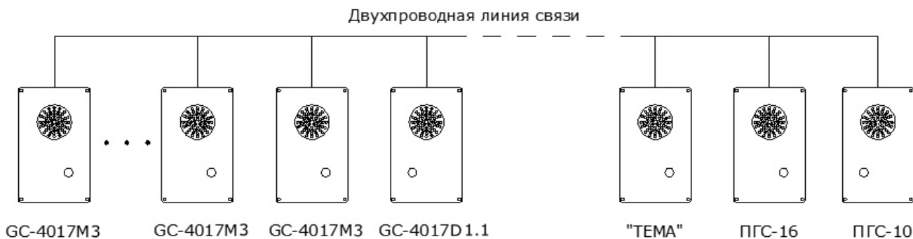
Рисунок 2. Структурная схема системы связи «один говорит – все слушают».

На рис.2 приведена структурная схема системы связи «один говорит – все слушают».